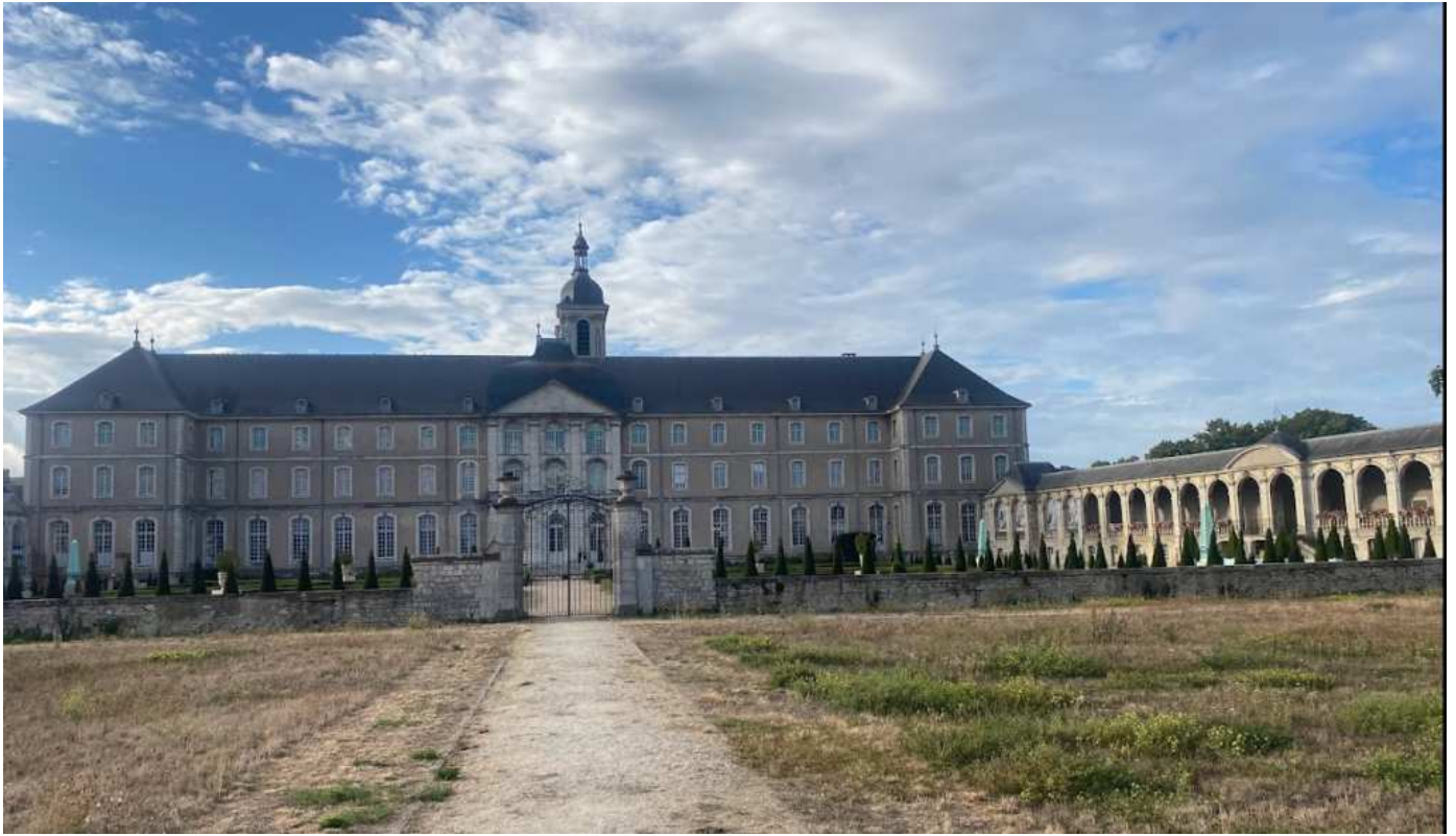
Notre départ avait lieu aux Prémontrés