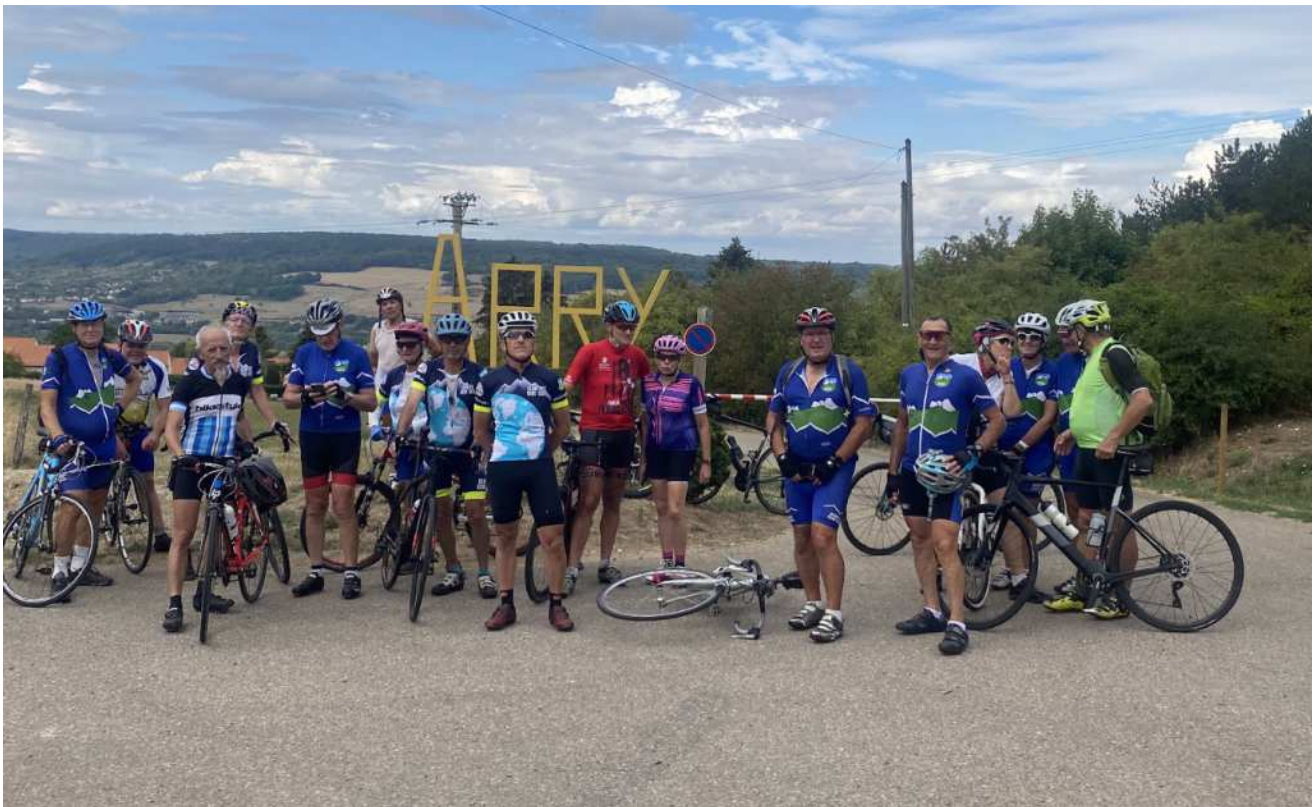
En haut du col d'Arry.