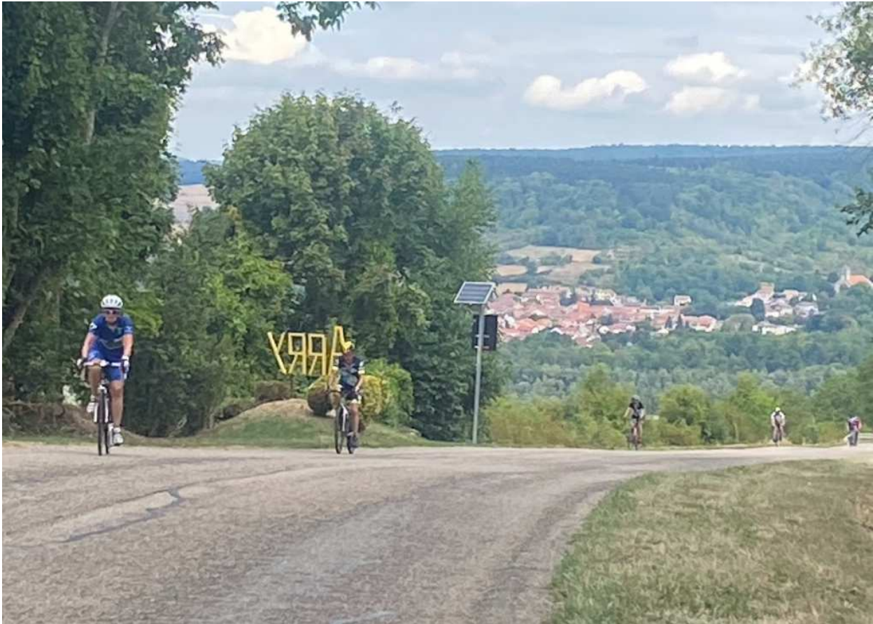
La montée du col d'Arry était coriace