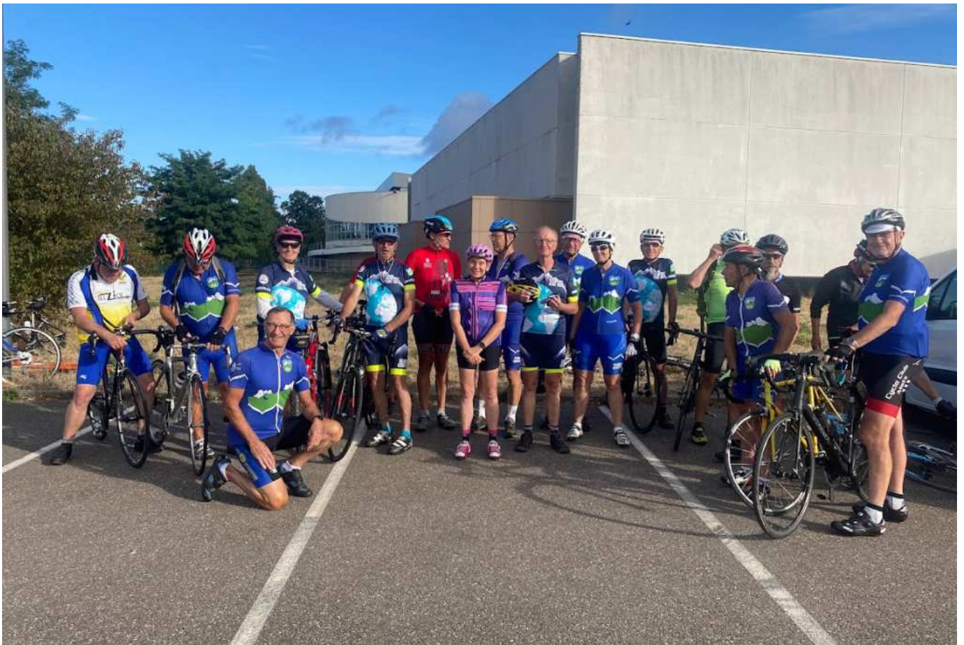
Une vingtaine de participants