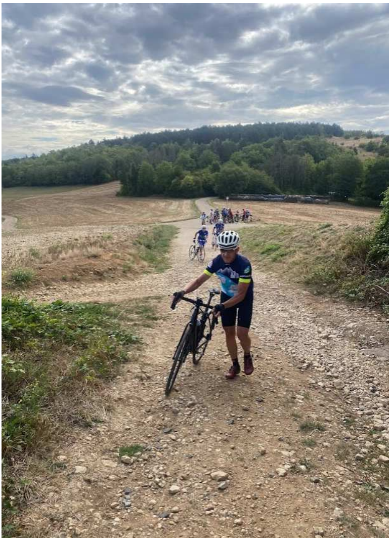
Un peu de cailloux pour le premier col de Rudemont (255m)